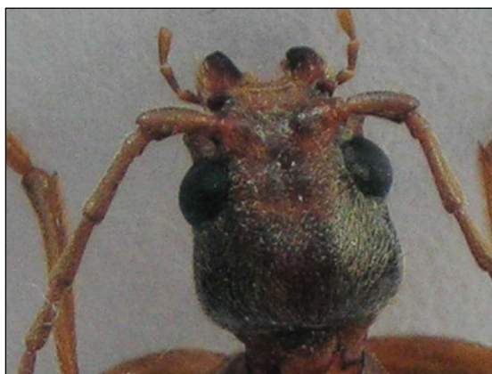
Figura 4. Cabeza de V. lucasi ♀. Figure 4. Head of V. lucasi ♀.

Variabilidad: Las mandíbulas pueden ser finas y puntiagudas o gruesas y romas. El punteado de las inserciones antenales y de los escapos puede ser abundante o escaso. La cara exterior de las mandíbulas puede tener pubescencia abundante o escasa. Las antenas hacia atrás apenas rebasan la región humeral en algunos ejemplares o la rebasan algo más en otros. El extremo inferior del escudete puede ser redondeado o sinuado.