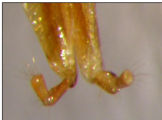
Figura 5. Ovipositor de V. lucasi . Figure 5. Ovipositor of V. lucasi .