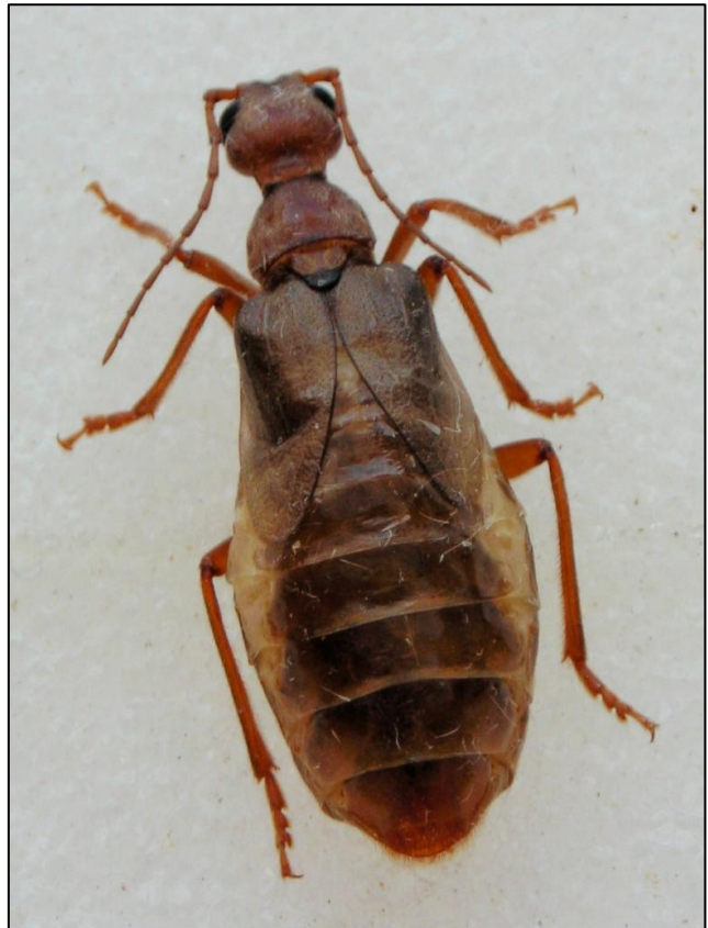
Figure 2. Biometrics interocular distance: DI and elytral length: LE.