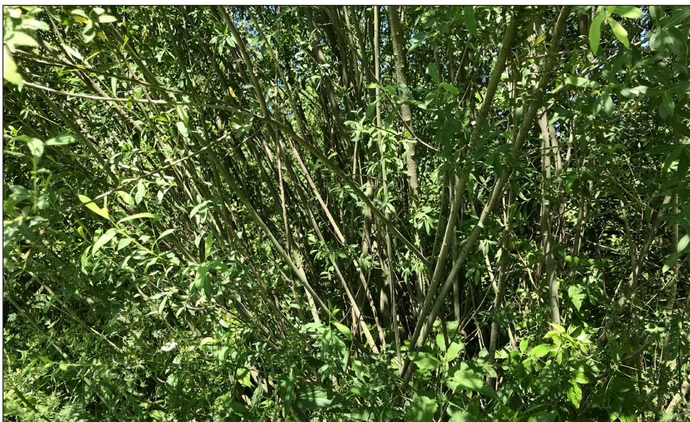
Ryc. 6. Biotop Exocentrus stierlini GANGLB. w Biebrzańskim Parku Narodowym