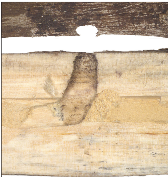
Ryc. 4. Exocentrus stierlini GANGLB. – kolebka poczwarkowa z otworem wylotowym.