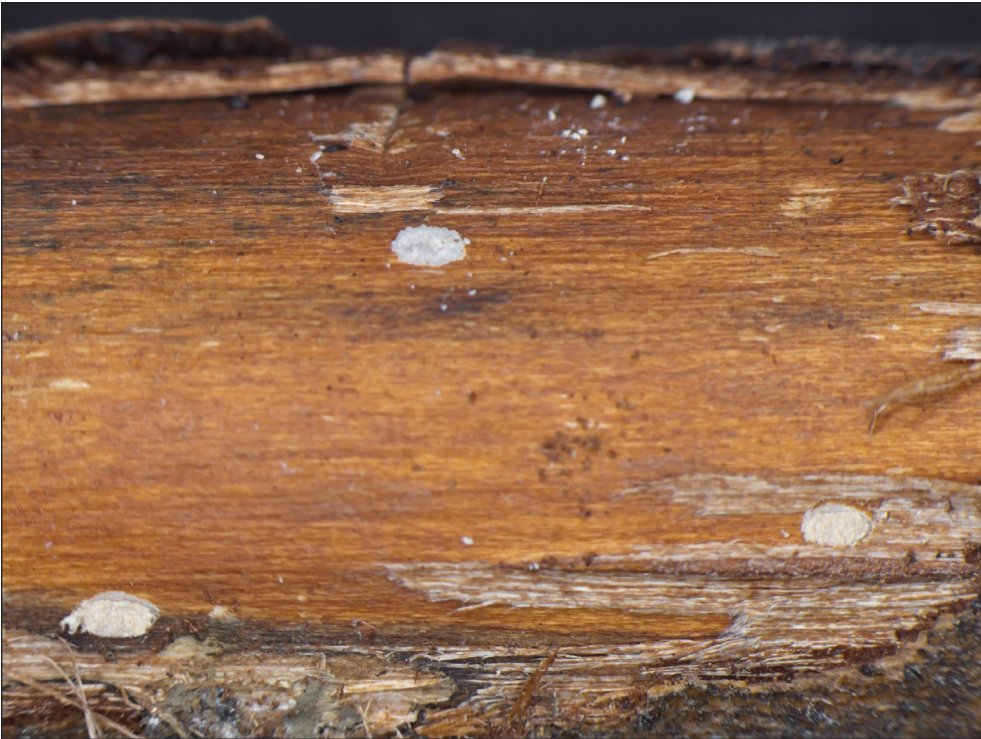
Ryc. 3. Exocentrus stierlini GANGLB. – otwory wejściowe larw do gałązek.