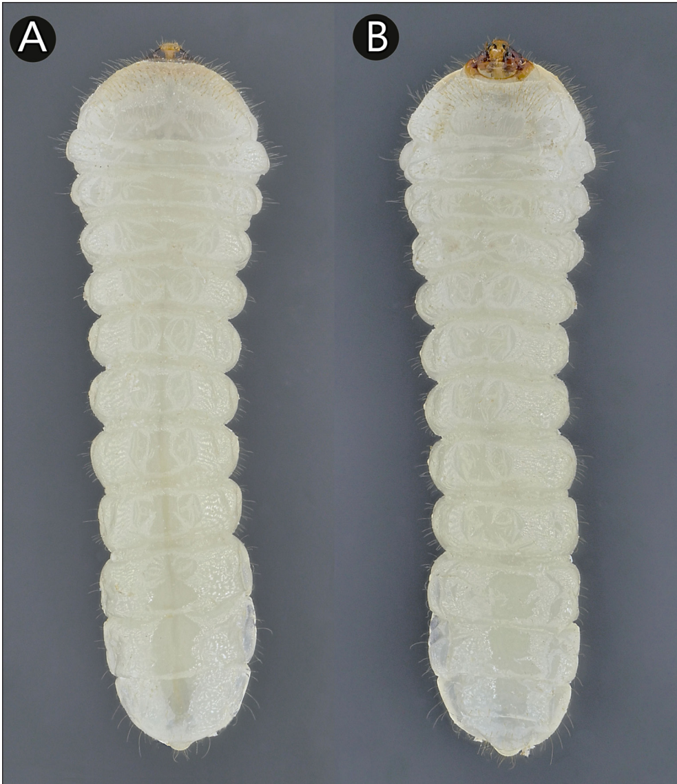
Ryc. 5. Exocentrus stierlini GANGLB. – Biebrzański Park Narodowy, larwa, leg. et coll. JK., strona grzbietowa (A), strona brzuszna (B).