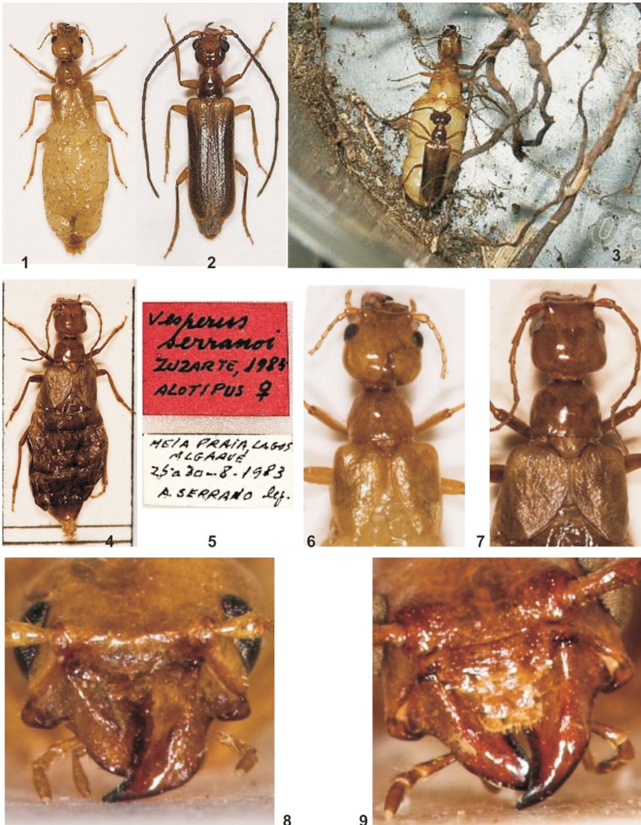
Fig. 1. Hembra de Vesperus jertensis Bercedo Páramo & Bahillo de la Puebla, 1999. Fig. 2 Macho de Vesperus jertensis . Fig. 3. Cópula de Vesperus jertensis . Fig. 4. Habitus de la hembra de Vesperus serranoi Zuzarte, 1985 (alotipo). Fig. 5. Etiquetas del ejemplar alotipo de Vesperus serranoi Zuzarte, 1985. Fig. 6. Detalle de la cabeza, pronoto y elitros de Vesperus jertensis . Fig. 7. Detalle de la cabeza, pronoto y elitros de Vesperus serranoi . Fig. 8. Mandíbulas de Vesperus jertensis . Fig. 9. Mandíbulas de Vesperus serranoi . Fig. 1. Female of Vesperus jertensis Bercedo Páramo & Bahillo de la Puebla, 1999. Fig. 2. Male of Vesperus jertensis . Fig. 3. Vesperus jertensis in copula. Fig. 4. Vesperus serranoi Zuzarte, 1985: habitus of female (allotype). Fig. 5. Vesperus serranoi Zuzarte, 1985: labels of allotype. Fig. 6 Detail of head, pronotum and elytra of Vesperus jertensis . Fig. 7. Detail of head, pronotum and elytra of Vesperus serranoi . Fig. 8. Mandibles of Vesperus jertensis . Fig. 9. Mandibles of Vesperus serranoi .