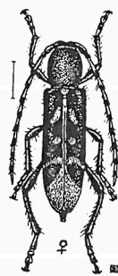
Abb. 1. Anaglyptus moreanus n. sp.

Flügeldecken an der Spitze abgerundet. (subgen. Cyrtophorus J. Lec.) 3. Fühlerglied, sowie 7. und 8. Fühlerglied mit einem kleinen Dörnchen bewaffnet. Fühler und Beine schwarz, nur die Tarsen und letzten Fühlerglieder rötlich. Kopf und Halsschild sowie die Flügeldecken ebenfalls ganz schwarz, Fgld. mit weißgelber Zeichnung. Ein schmaler Nahtstreif, der sich nach der letzten Binde nach außen verbreitert und im letzten Fünftel den Seitenrand erreicht, taubengrau behaart, ebenfalls das Schildchen.